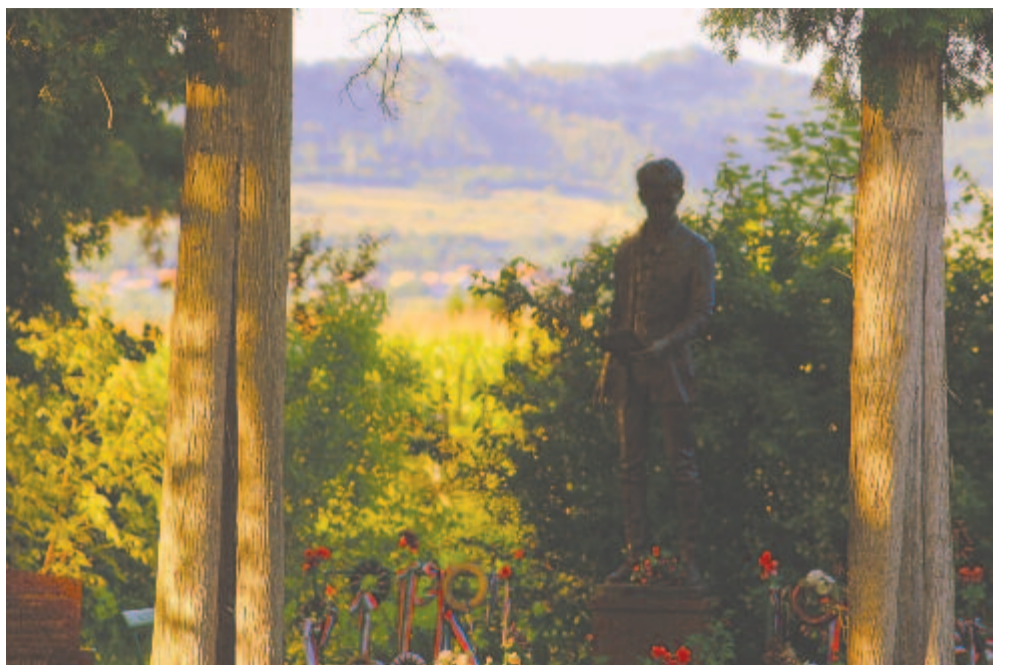
Fehéregyháza – egy otthoni kert fala több titkot zárhat magába, mint a kínai fal

Mind a mai napig ismeretlen maradt azonban nálunk művének nem regényes része, a halála után kiadott esszéik, jegyzetek és első-sorban a Citadella . Ebben a csak halála után megjelent műben írta volt: