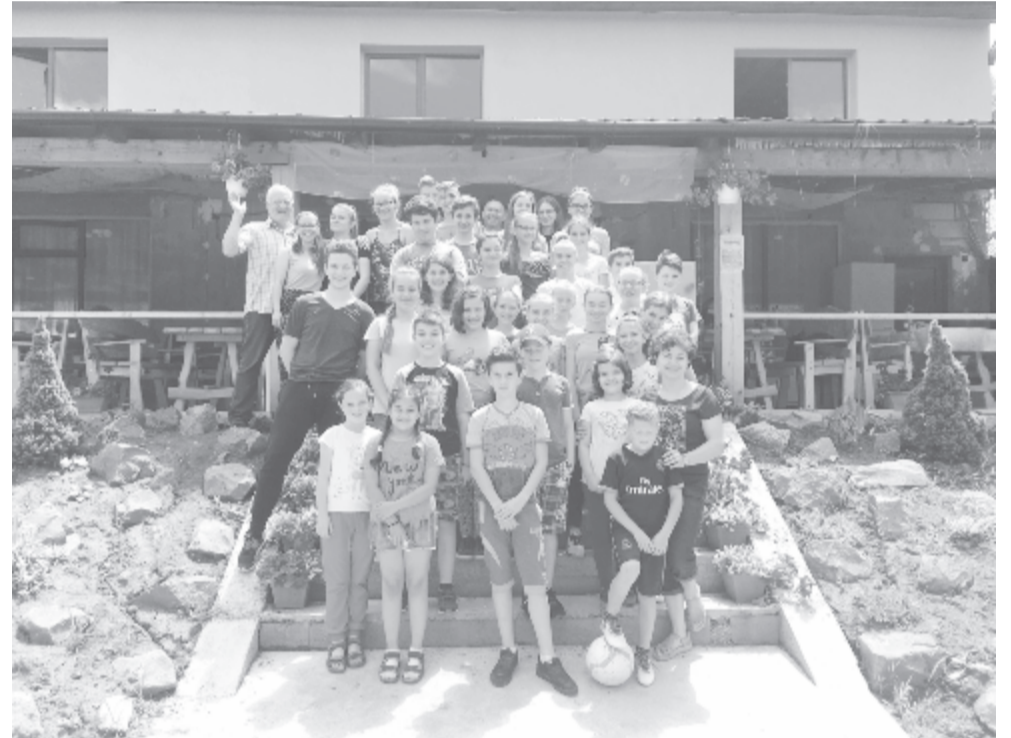
Mindenki jól érezte magát a táborban