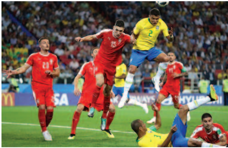
Thiago Silva jó ütemben érkezett a bal oldali szögletből beívelt labdára, és négy méterről a rövid kapufa mellé fejtelt, ezzel megszerezte csapata második gólját