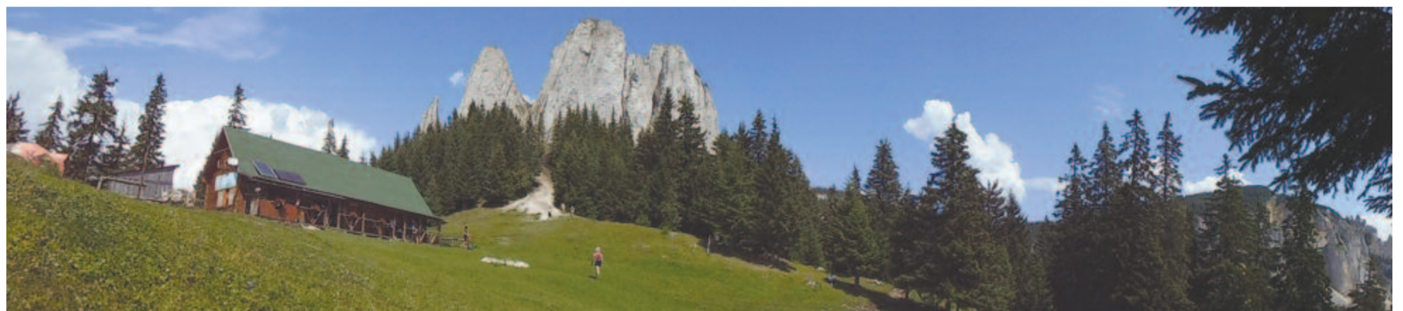
Egyeskő – odaültetlek a hegy tetejére, ahonnan minden vitás kérdésed megoldódik, és hagyom, hogy magad szürod ki ebből az igazságot

Kelt 2018-ban, 562 évvel azután, hogy III. Kallixtusz pápa az 1456. június 29-én kiadott imabullájában elrendelte a Nándorfehérvár elleni török támadás kivédésére irányuló könyörgésként a déli harangszót .